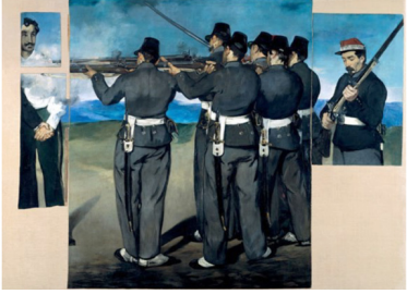
Resim 5. Execution of the Emperor Maximilian. Temmuz 1867. Tuval üzerine yağlıboya. 195.9 x 259.7 cm. Museum of Fine Arts, Boston