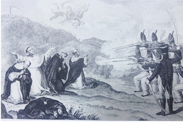
Resim 2. Anonim, Valencialı Beş Keşişin Katledilişi, Milli Kütüphane, Madrid

3 Mayıs 1808 günümüzün en büyük insanlık suçlarından, insanoğlunun işlediği en büyük günahlardan birinin belgesidir. Goya'da bu eserinde savaş ve acı temasını içeren en iyi kompozisyonlardan birini üretmiştir. Bu sayede birçok esere ilham kaynağı olmuş ve resimsel alıntılama yoluyla birçok ressam eserinde gerek figürlerin konumlanması gerekse renk unsurlarından faydalanmış ve kendilerine mal etmişlerdir.