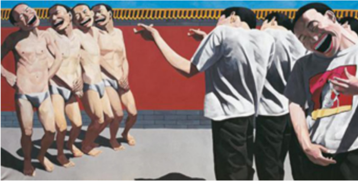
Resim 11. Yue Minjun 1995, İdam (Execution)

resminde sözü edilen duygusuzca katliam yapımları için merhamet duygusunu köreltmış, hissizleşmiş, makine askerler tabiri Picasso'nun bu eserinde özüne ermiştir. Hamile kadın ve çocuklara yöneltilen namlular ile ne derece duygusuz sadece emirlere uyan makineler olduklarını da göstermişlerdir. "Çağdaş sanat tanık olma potansiyeli üzerinde bizlere gerçeği göstermenin ötesine olguyu içselleştirmeye odaklanmaktadır. Çünkü acı ne kadar artıyorsa duyarsızlaşma da o derece fazlalaşmaktadır. Toplumsal olaylara yönelik kayıtsızlığın tahammül edilemediği noktalarda sanatçılar müdahale derecesinde işlere imza atıyorlar". Sanat eserleri, kimi zaman toplumsal acıları hissizleştirip birer makine gibi algılanmasını sağlarken, kimi zaman bu acıların daha da uygun bir şekilde hissedilmesini sağlayabilmektedir.