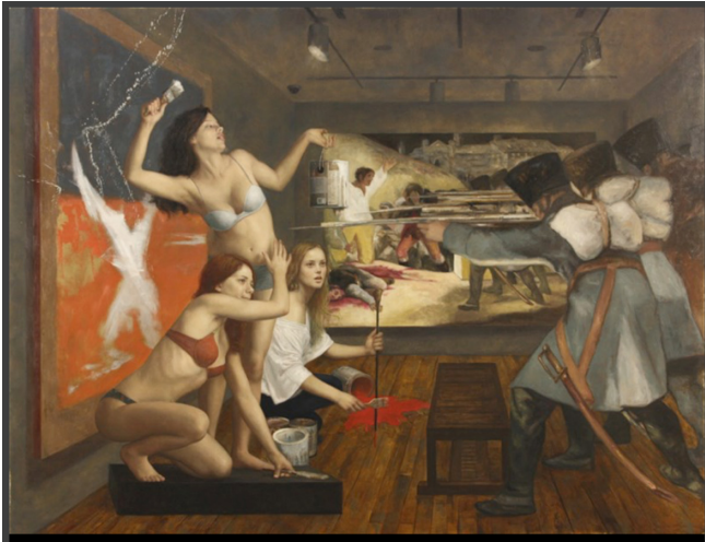
Resim 12. Cesar Santos 2013, Üç Güzeller (The Three Graces)

Minjun, tarihteki yanılğı ve merhamet eksikliklerini yeniden kendine özgü bir şekilde ele almıştır. Tüm bunlar insanlık için utanç verici durumlardır. Sanatçı tüm bunların yanında, üslubuyla Çin Hükümeti'ne de alaycı bir dille gönderme yapmaktadır.