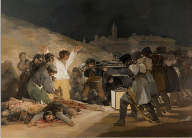
Resim 1. Francisco de Goya, 1814, 3 Mayıs 1808, Museo del Prado, Madrid

1814 tarihli 268 x 347cm boyutlarındaki yağlıboya tablo günümüzde Madrid, Museo del Prado'dadır. İspanyol ressamın, aynı boyutlardaki eş çalışması 2 Mayıs 1808 (Memlüklerin Saldırısı) de tıpkı bu tablo gibi İspanya'nın geçici hükümeti tarafından, Goya'nın önerisi ile, ressama ısmarlanmıştır. 1814 yılı şubat ayında Fransızlar İspanya'dan kovulmuştur. Geçici hükümete yapmak istediği resimle ilgili talebini bildirmiş ve önerisi kabul edilmiştir**. Goya, Aragonca yazdığı bir mektupta bu tabloları yapma amacını şöyle açıklamıştır "...Avrupa'nın zorbarlarına karşı giriştiğimiz şerefli ayaklanmanın en olağanüstü ve kahramanca hareketlerini fırça darbelerim ile ebedileştirmek"***.