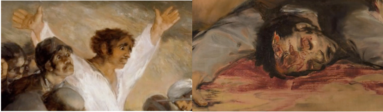
Resim 3. Francisco de Goya, 1814, 3 Mayıs 1808 (Detay-1)

Valencialı Beş Keşişin Katledilişi isimli ahşap üzerine gravür baskı “3 Mayıs” tablosunun esin kaynağı gibi görünmektedir**. Zira o dönemde Napoleon’un Tanrıtanımaz görüldüğü Roma Katolik İspanya’da yaygınlaşan baskılardan biridir***. Öldürülmek üzere olan kurbanın diğerlerinden farklı beyaz kıyafeti, başının tepesi tıraşlı, dizlerinin üstüne çökmüş keşişin iki elini açarak yalvarması ve yerde yatan bir süre önce öldürülmüş ceset iki resim arasındaki benzerliklerden bazılarıdır. Hatta bu gravürden kompozisyonu ayıran tek özellik Goya’nın tablosuna melekler yerleştirmemiş olmasıdır. Resimlerarası etkileşimi Goya tablosundan başlatırken karşımıza çıkan bu bilgi ile öykünme sonucu üretilen bir eserin yine alıntı yoluyla günümüz eserlerine de ilham kaynağı olduğunu görmekteyiz. Farklı konular doğrultusunda yeniden yorumlarını izlediğimiz bu kurgu düzeninde esas alınan figürlerin dizilişi, savaşın acısının ve felaketlerinin yanı sıra insanlık dramlarını anlatan ikilemler, zıtlıkları barındıran bir kompozisyonudur.