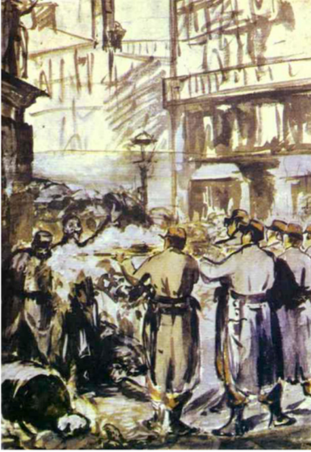
Resim 9. Edouard Manet, 1871, Barikat (The Barricade) National Galeri of Art, Washington DC

Manet, 1871 yılında ise, kurşuna dizerek infaz eden bir idam mangasını Paris sokaklarında işlerini yaparken resmetti. Ressamın, Barikat (La Barricade) isimli bu tablosunu da 3 Mayıs 1808'den etkilenerek çizdiği bilinmektedir*. Barikat eseri teknik