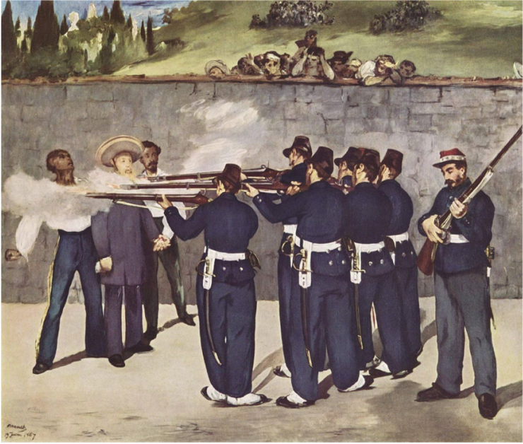
Resim 4. Edouard Manet, 1868- 69, İmparator I. Maximillian'ın İnfazı, Kunsthalle Mannheim, Germany

Hem pop art hem de onun uzantısı olan postmodern resim, bi-reşimsel bir yapı tanımlamasına uyar. Ayrışıklık farklı etkilerin, farklı biçimlerin, düşüncelerin vb. birlikteliği olarak tanımlanır. Farklı disiplinlerin verilerini aynı uzamda buluşturarak birçok biçimlilik ya da çokseslilik alanı oluşturulur. Ayrışık unsurların birlikteliğinden kendi içinde tutarlı bir yeni ürün çıkarılır*. Ötekinin yapıtını alıntılıyarak yeniden resmedilen her eser ötekine gönderme yapan bir varyasyon olarak kabul görmektedir. Bu durumda varyasyonlar bir resme eleştirel olarak bakma yöntemine dönüşmüş ve esere katılan yorum sayesinde hem yapıtı açıklamış hem de başka bir yapıt olma özelliği taşımıştır.